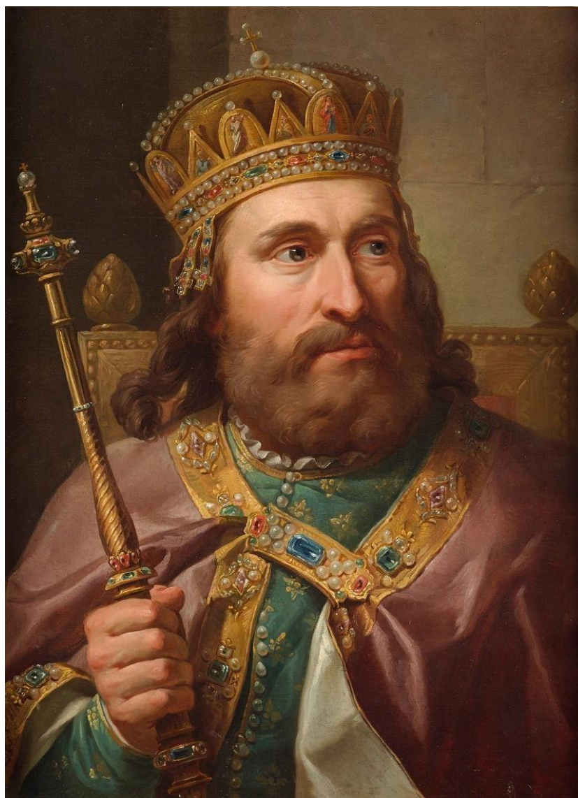
Кароль Людвік Венгерскі ў кароне св. Іштвана

Справа ў тым, што нашчадкі Ягайлы нейкі час былі і венгерскімі каралямі. Аднак у 1526 г. туркі разграмілі венграў у бітве каля Мохача, там жа загінуў і малады кароль Лаяш (Людвік) Ягелон. Пасля яго каралём стаў Януш Запальяі, муж Ізабэлы Ягелонкі, роднай сястры жонкі Баторыя Ганны. Запальяі, які быў прызнаны каралём толькі часткай венграў, зрабіў сабе карону, якая была копіяй знакамітай кароны святога Іштвана (Стэфана).