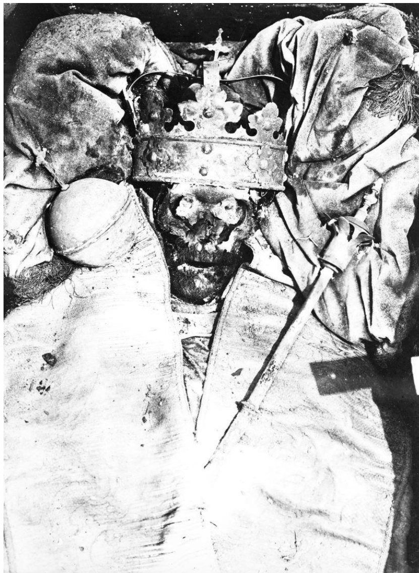
Цела Баторыя ў зробленай у Гродне кароне пасля ўкрыцця ягонай труны ў 1930-м годзе

некалькі зламаных сярэбраных паўміскаў, што дакладна зафіксавалі перапісчыкі каралеўскіх рэчаў.