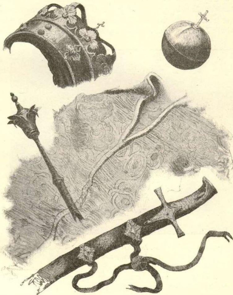
Korona, berło, jabłko, szabla i kapa kr. Stefana Batorego, odrysowane przy otwarciu jego trumny w r. 1877.

Dąbrówki, 4) Racjonal królowej Jadwigi, 5) Talerz emaljowany kr. Aleksandra Jagiellończyka, 6) Relikwiarz i monstrancja Zygmunta I, 7) Skrzyneczka na klejnoty królowej Bony, 8) Klejnoty po Zygmuncie I, 9) Oprawa do książki Zygmunta Augusta, 10) Klejnoty Zygmunta III, 11) Puszka własnoręcznej roboty Zygmunta