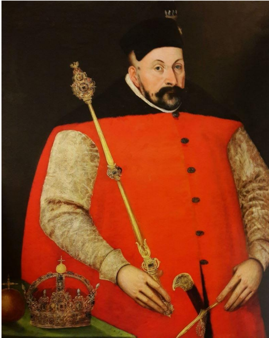
Партрэт Стэфана Баторыя з маньерыстычнай каронай

На адным з партрэтаў Стэфан Баторый паказаны з каронай, выкананай паводле праекту таленавітага фламандца. Яна багата аздоблена пярлінамі, а яе знешні выгляд цалкам адпавядае тагчаснай модзе на разнастайныя геаметрычныя фігуры і раслінны арнамент. Лёс гэтай кароны Баторыя, безумоўна нятаннай і дарагой каралю, невядомы.