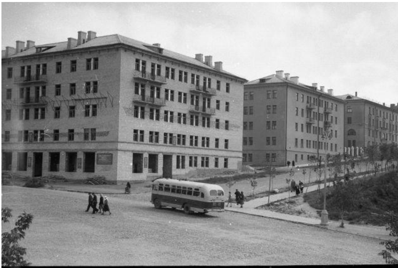
1959 год. Новые дома по ул. Парижской Коммуны.