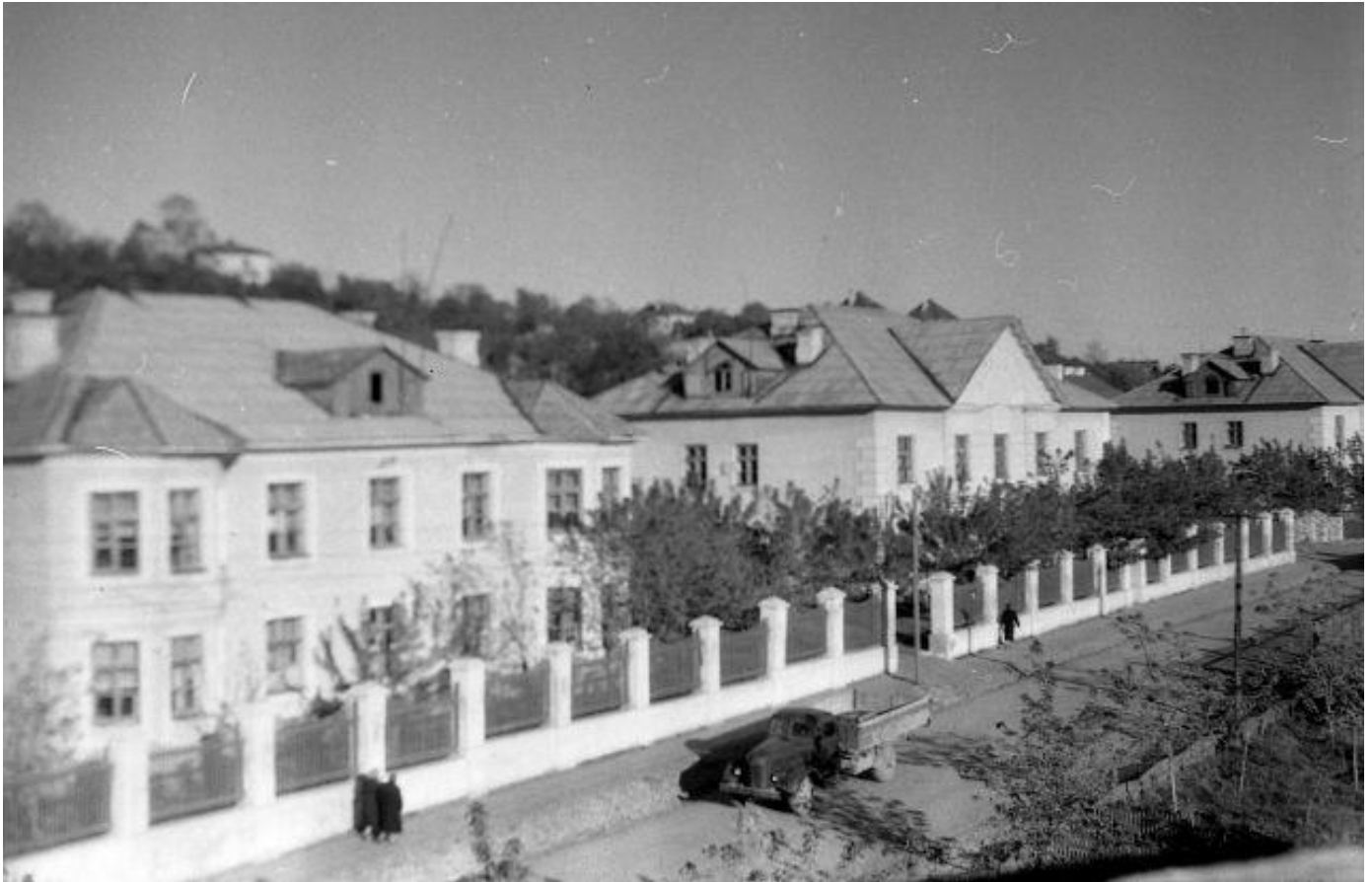
Октябрь 1957 года. Ул. Социалистическая. Новые дома.