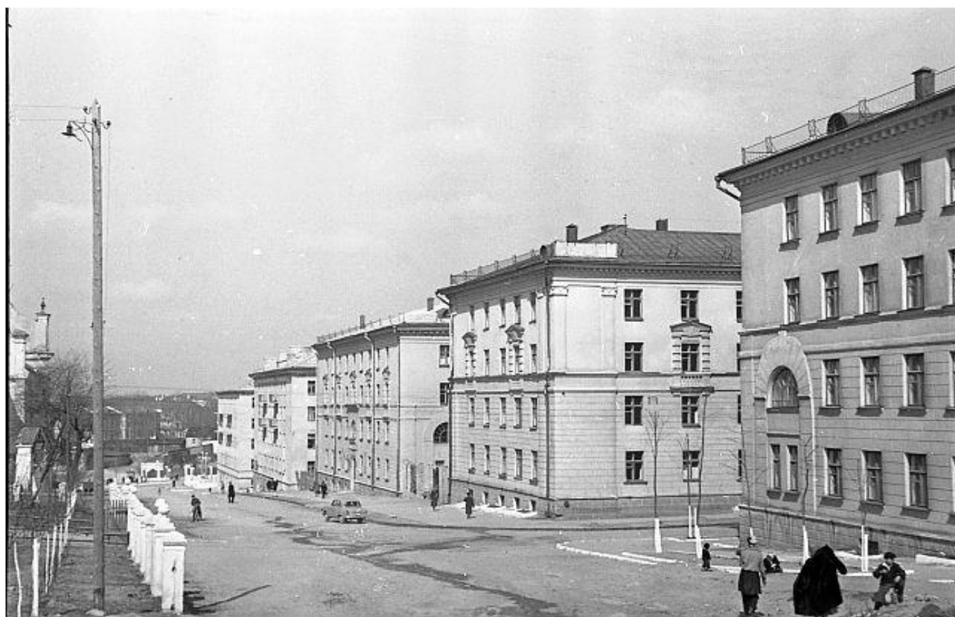
Октябрь 1957 года. Ул. Подольная. Новые дома для работников тонкосуконного к-та.