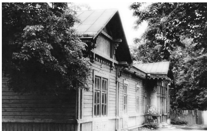
Здание школы по улице Александровской, 7

В 1874 году Гродненская городская дума возбудила ходатайство перед губернским правлением о разрешении открыть повивальную школу в Гродно и выделить землю под ее постройку. 6 мая 1874 года глава Гродненской губернии Александр Елпидифорович Зуров дал разрешение на открытие повивальной школы в Гродно по улице Александровской, 7 (ныне Буденного).