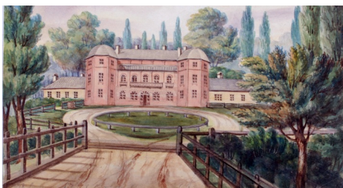
Здание Гродненской медицинской академии. Рисунок Наполеона Орды XIX век. В академии обучали на 3 отделениях, в том числе и отделение подготовки повитух.

Школа располагала небольшой библиотекой, где находились книги по акушерству, Закону Божьему, арифметике, русскому языку, а также книги беллетристического содержания. Помимо книг, в библиотеке хранилась коллекция патологоанатомических препаратов женских половых органов, плоды и уродства, которые сгорели в пожар 19 марта 1886 года. Своей аптеки не было, поэтому лекарства покупались в вольной аптеке провизора Оттовича с 65% скидкой. Простые лекарства составляли сами ученицы, о чем свидетельствовали имеющиеся в школе аптекарские вещи: ступки, мензурки, весы.