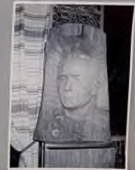
Снимок Ильи Борисова, сделанный в музее Михаила Васильевича и Сиддела