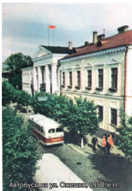
Автобусы на ул. Ожешко, 1950-е гг.

После окончания войны гродненцы высадили множество деревьев. Берега Немана и улицы городского центра в советскую эпоху утопали в зелени, оставаясь тенистыми и прохладными даже в летнюю жару. Поэтому прогулки по ним были особенно приятными. Вдоль Советской улицы росли многочисленные липы и клёны, рябина. В районе Советской площади имелись небольшой сквер напротив дома Муравьева, на месте бывшего бульвара-Телятника XIX века, и скверик за Дворцом культуры текстильщиков, к которым после сноса в 1961 году бывшего Гарнизонного