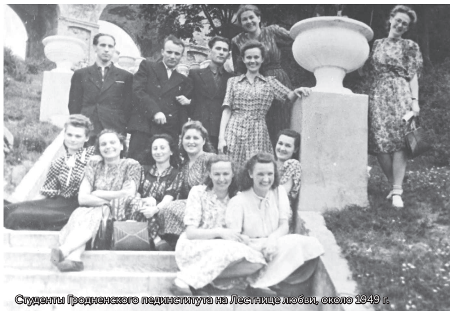
Студенты Гродненского пединститута на Лестнице любви, около 1949 г.