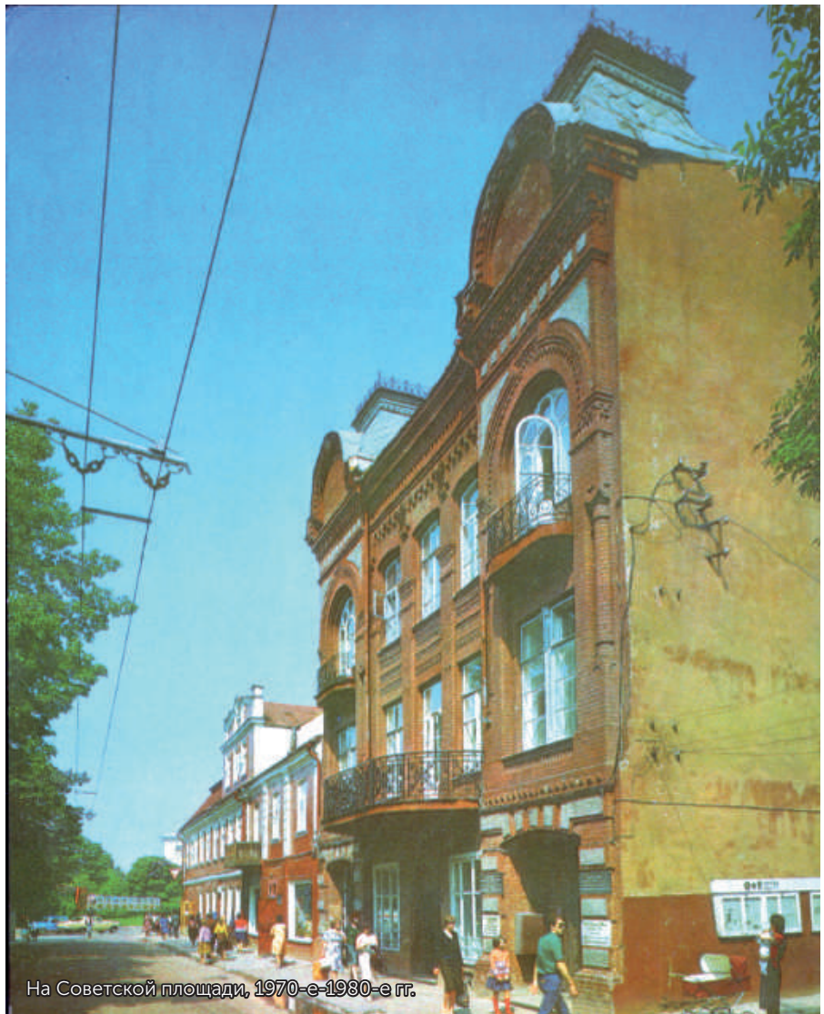
На Советской площади, 1970-е-1980-е гг.

Об особенностях советского шопинга, прелестях гродненского общепита и культурной программе выходного дня читайте в следующем номере.