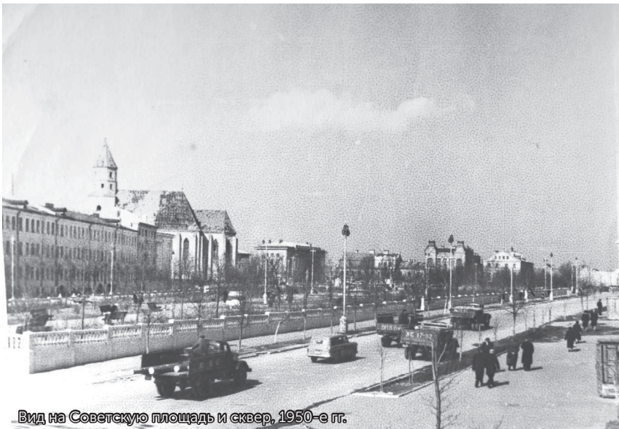
Вид на Советскую площадь и сквер, 1950-е гг.