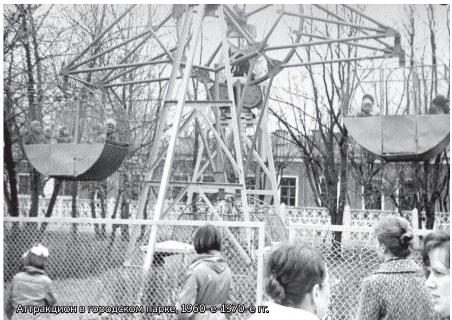
Аттракцион в городском парке, 1960-е-1970-е гг.