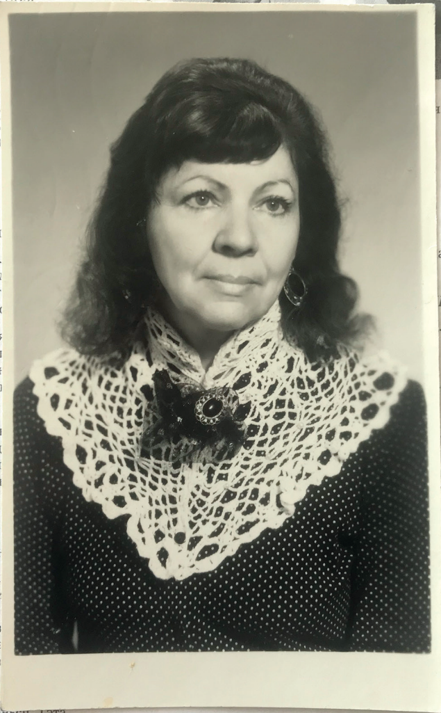
Доктар сельскагаспадарчых навук (1989), вучоны-глебазнаўца. Нарадзілася 25.12.1933 г. ў в.