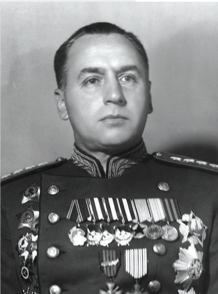
Генерал армии А.И. Антонов (1896 — 1962): «Он обладал гениальным постижением замыслов противника и умением хитроумно их разрушить»

Алексей Иннокентьевич Антонов – советский военачальник, генерал армии, член Ставки ВГК, начальник Генерального штаба в 1945 – 1946 годах, первый начальник Штаба Объединённых вооружённых сил стран Организации Варшавского Договора. Прославился как талантливый штабной офицер. Единственный из всех советских военачальников, награждённых орденом «Победа» в звании генерала армии, и единственный советский кавалер ордена, которому не было присвоено звание Героя Советского Союза.