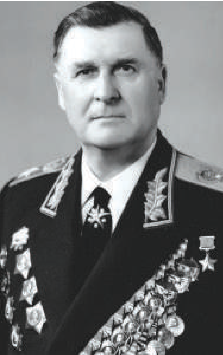
Маршал победы В.Д. Соколовский (1897 – 1968): «Защита отечества была главным делом его жизни»

Василий Данилович Соколовский – советский военачальник, Маршал Советского Союза и Герой Советского Союза. Родился 9 июля 1897 года в семье бедных крестьян в деревне Козлики Белостокского уезда Гродненской губернии. В 1905 году окончил церковно-приходскую школу и с этого года работал подёнщиком на кожевенном заводе в Заблудово. Несколько лет трудился там и усиленно занимался самообразованием. Позже с отличием окончил двухклассную учительскую школу и Невельскую учительскую семинарию.