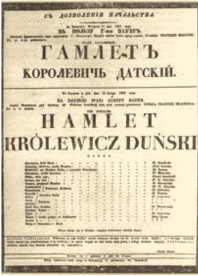
Гродненская афиша, 11 февраля 1843 года

Так были поставлены пьесы «Поют жаворонки» К. Крапивы, «Трибунал» А. Макаёнка, «Последний шанс» В. Быкова. Особенно продуктивным сотрудничество было во второй половине 70-х годов, когда театр возглавил известный белорусский писатель Владимир Короткевич. Это были годы постановки белорусских произведений и играли их на белорусском языке.