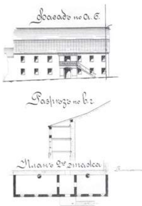
Проект перестройки Гродненского театра, 1896 год

Огромной популярностью среди жителей нашего города пользовался театр, организованный в 1802 году актрисой и антрепренёром Соломеей Дешнер. Как часто бывает, повлиял случай. В тот год 9 (21) июня в здании театра Тызенгауза праздновали открытие Гродненской губернии. Приехал сам российский император Александр I, выступали артисты. Однако в самый разгар торжества с