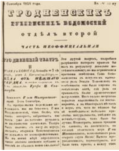
Гродненские губернские ведомости. фрагмент рецензии на театральную постановку, сентябрь 1854 год

театрального коллектива, Московского государственного театра кукол. Осенью 1939 года сразу после воссоединения белорусов театр Образцова посетил Гродно с гастролями. После оккупации Польши фашистами во время Второй мировой войны именно сюда стекались многие культурные деятели, спасаясь от нацизма: музыканты, актёры, режиссёры, журналисты. В неофициальных кругах Гродно получил название «культурного Пьемона». В городе оказались музыкант Эдди Рознер, экстрасенс Вольф Мессинг, писатель Густав Херлинг-Грудзинский, актёры Владислав и София Ярема. Последние очень заинтересовались спектаклями коллектива Сергея Образцова и загорелись огромным желанием создать такой же театр и в Гродно, это им с успехом удалось при поддержке всё того же Образцова. Правда, скорая Великая Отечественная война прекратила деятельность театра. Его второе рождение состоялось уже в мирное время в статусе театра кукол при Доме народного творчества – «в целях систематического обслуживания детей дошкольного и школьного возрастов самостоятельным кукольным коллективом». Труппа была неболь-