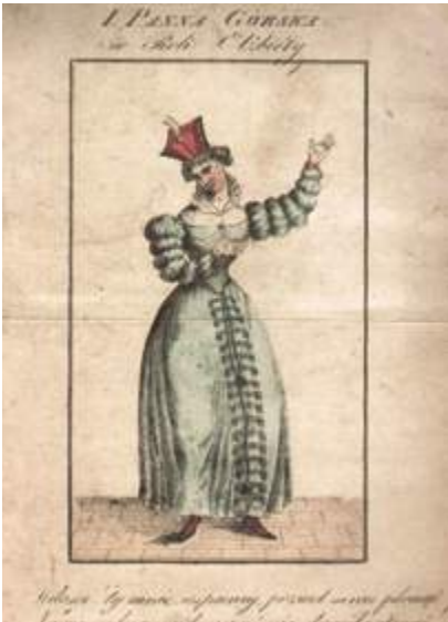
Афиша спектакля с изображением ведущей актрисы Изабеллы Гурской, 1838 год

Газета «Гродненские губернские ведомости», начиная с 1860-х годов, активно освещала