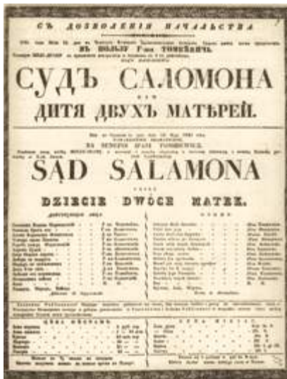
Гродненская афиша, 15 мая 1841 года