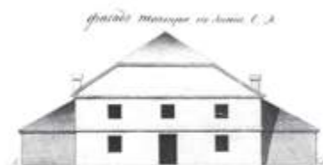
Teatr w Grodnie, budynek powstał w 1818, 1827