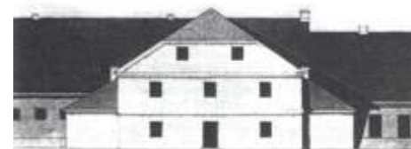
Teatr w Grodnie, budynek powstał w 1772

После отставки в 1780 году Тызенгауза и последовавшего за этим закрытием театра, гродненская труппа вошла в состав Варшавского королевского театра, а в зда-