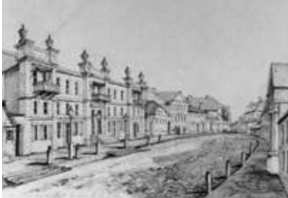
В доме Ромера во второй половине XIX века выступали известные артисты. Рисунок Н. Орды

Там, а также в городском театре, члены семей офицеров гарнизона, нередко и с участием самих офицеров, проводили любительские спектакли и концерты, на которые могли приобрести билеты все желающие. Нередко такие мероприятия были благотворительными. Летом культурная жизнь гарнизона перемещалась в военный лагерь в Румлёво, где в 1890-е годы был выстроен клуб офицерского собрания и библиотека. Выступали в зале Военного собрания и профессиональные музыканты, артисты.