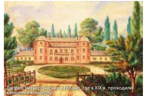
Дворец Четвертинских в Гродно, где в XIX в. проходили камерные концерты