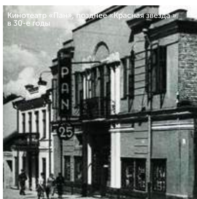
Кинотеатр «Пан», позднее «Красная звезда» в 30-е годы

В 1920-х годах, кроме кинематографа «Эден» в Гродно работало ещё три кинотеатра: «Лири», «Люкс», «Сатурн». В 30-е годы их стало семь. Накануне Великой Отечественной войны в Гродно работали кинотеатры «Третий интернационал», «КИМ» и «Красная звезда».