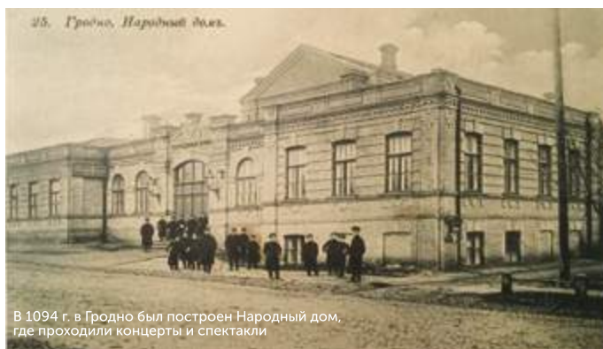
В 1094 г. в Гродно был построен Народный дом, где проходили концерты и спектакли