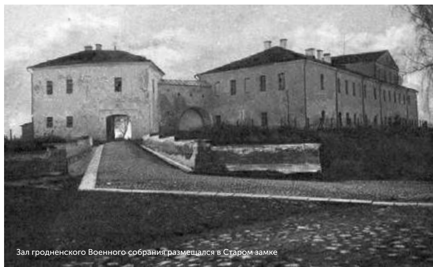
Зал гродненского Военного собрания размещался в Старом замке

В домах многих дворян, чиновников, офицеров и мещан устраивались семейные концерты, в которых также могли поучаствовать или стать зрителями гости, соседи, родственники и друзья.